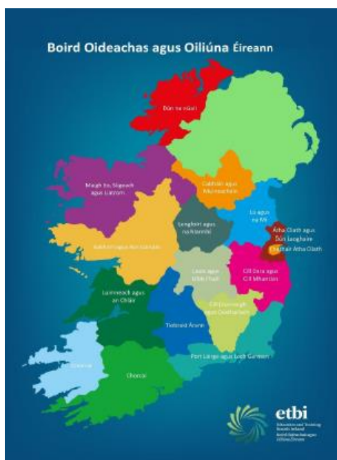
Fíor 1: Boird Oideachais agus Oiliúna (BOOanna) in hÉireann

Tá sé cinn déag de BOOnna ar fud na tíre, mar a thaispeántar i bhFíor 1 thíos.